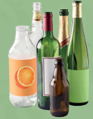
Bouteilles en verre