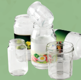
Bocaux de conserves et pots en verre